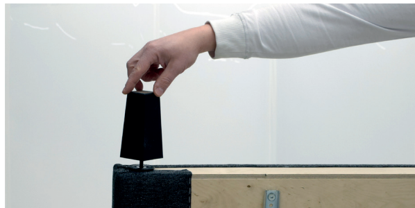
2 Jalka kiinnittyy pyörittämällä.