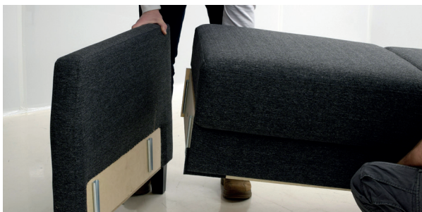
3 Kiinnitä istuinrunko käsinojaan.