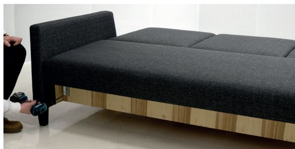
8 Kiinnitä selkänöjan saranan lukitusruuvi.