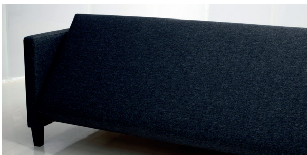
7 Levitä sohva vuodeasentoon.