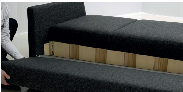
5 Kiinnitä selkänöja istuinrunkoon. Kohdista selkänöjan saranat istuinrunгон vastakappaleisiin.