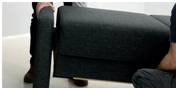
4 Kohdista istuinrunгон helat käsinojan helojen kanssa ja pudota istuinrunko paikoilleen.